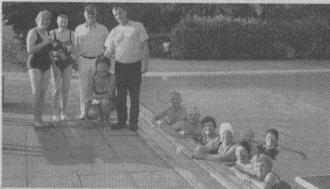
Die Frühschwimmer in Bevern bilden eine fröhliche Gemeinschaft.

bad seine Pforten schließt, muss noch das Becken gesäubert und natürlich die Wärmeschutzplanen wieder über das Nichtschwimmerbecken gezogen werden. Damit das Wasser auch am nächsten morgen wieder schön warm ist. (nig)