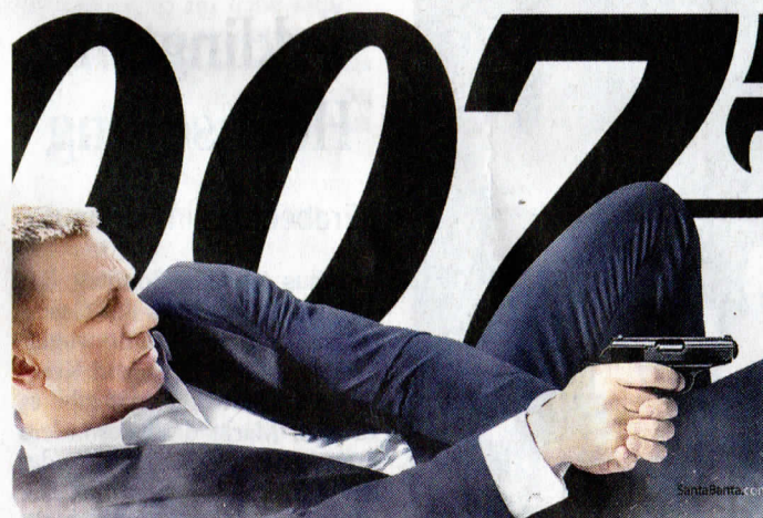
James Bond am Boden: In „Skyfall“ passiert das dem Agenten häufiger.